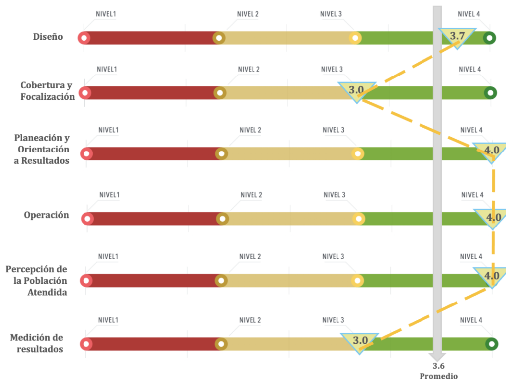
Figura 2. Valoraciones de las temáticas del FAETA-EA

Finalmente, se destaca la necesidad de desarrollar un plan integral para mejorar la retención y formación de los asesores educativos, ya que su rol es crucial para garantizar la calidad y cobertura de los servicios ofrecidos por el fondo.